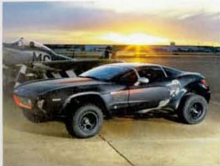
Freiwillige Konstrukteure haben den martialischen Rallye-Fighter in Rekordzeit entwickelt.

Von außen sieht der „Rallye Fighter“ – eine Mischung aus Coupé und Geländewagen des US-Herstellers Local Motors – zwar ungewöhnlich aus, aber nicht revolutionär. Das wirklich Spannende ist seine Entstehung: Er wurde von einer 25 000 Mitglieder starken Internetgemeinde aus 122 Ländern entwickelt. Dazu nutzen sie eine Webplattform, über die sie Zugriff auf CAD-Dateien und eine Datenbank bekommen. Alle Entwürfe unterliegen einer Open-Source-Lizenz. In nur 18 Monaten